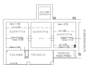
PIANO SECONDO SOTTOTETTO